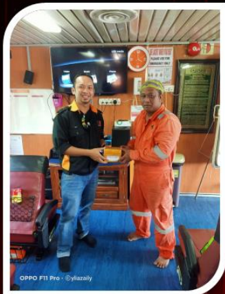
OPPO F11 Pro - @yktazally