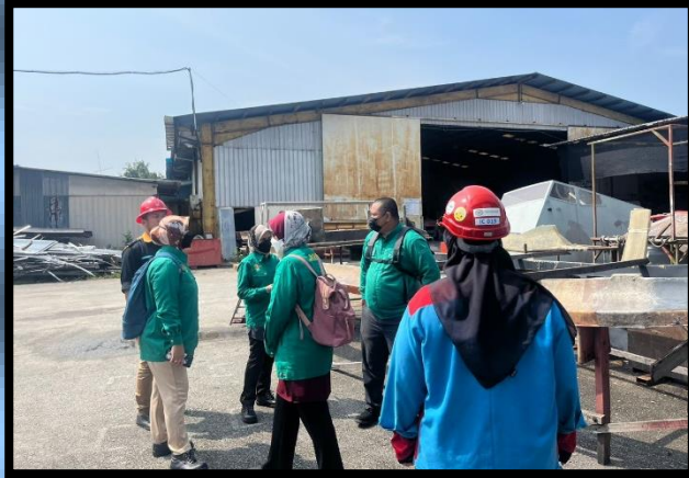
BUILDING EVACUATION DRILL & FE TRAINING TKSB 24.10.2023