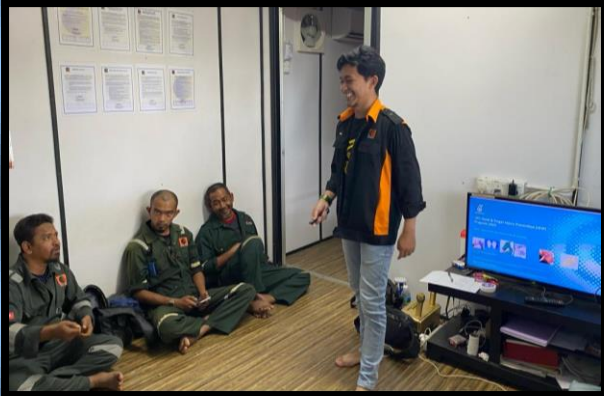
HFIP SAFETY CAMPAIGN MG 13.10.2023